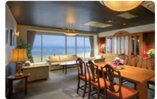
ロイヤルスイート(4名定員)