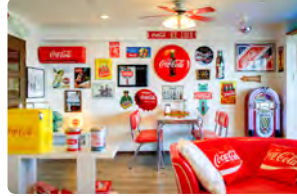
コーラ・コーラルーム(4名定員)