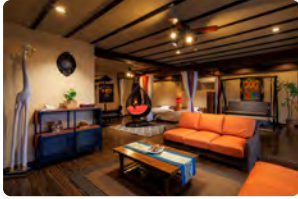
アジアリゾートルーム(4名定員)