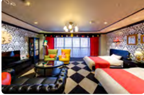
アリスルーム(4名定員)