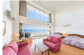
スカイスイート(4名定員)