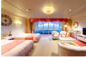
ティアラルーム(4名定員)