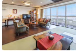
ハイカラ浪漫ルーム(4名定員)