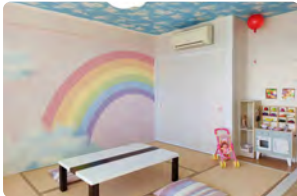
キッズルーム(最大4名定員) ※1