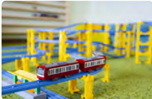
ト레인&ファミリールーム(最大6名定員) ※1